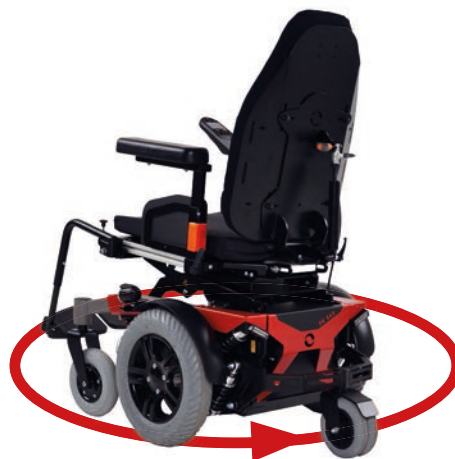
Max Wendekreis: 1400 mm

Dank der neuen LED Scheinwerfer fährst Du auch Nachts sicher auf den Strassen.